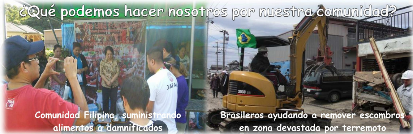
Comunidad Filipina, suministrando alimentos a damnificados

¿Qué podemos hacer nosotros por nuestra comunidad?